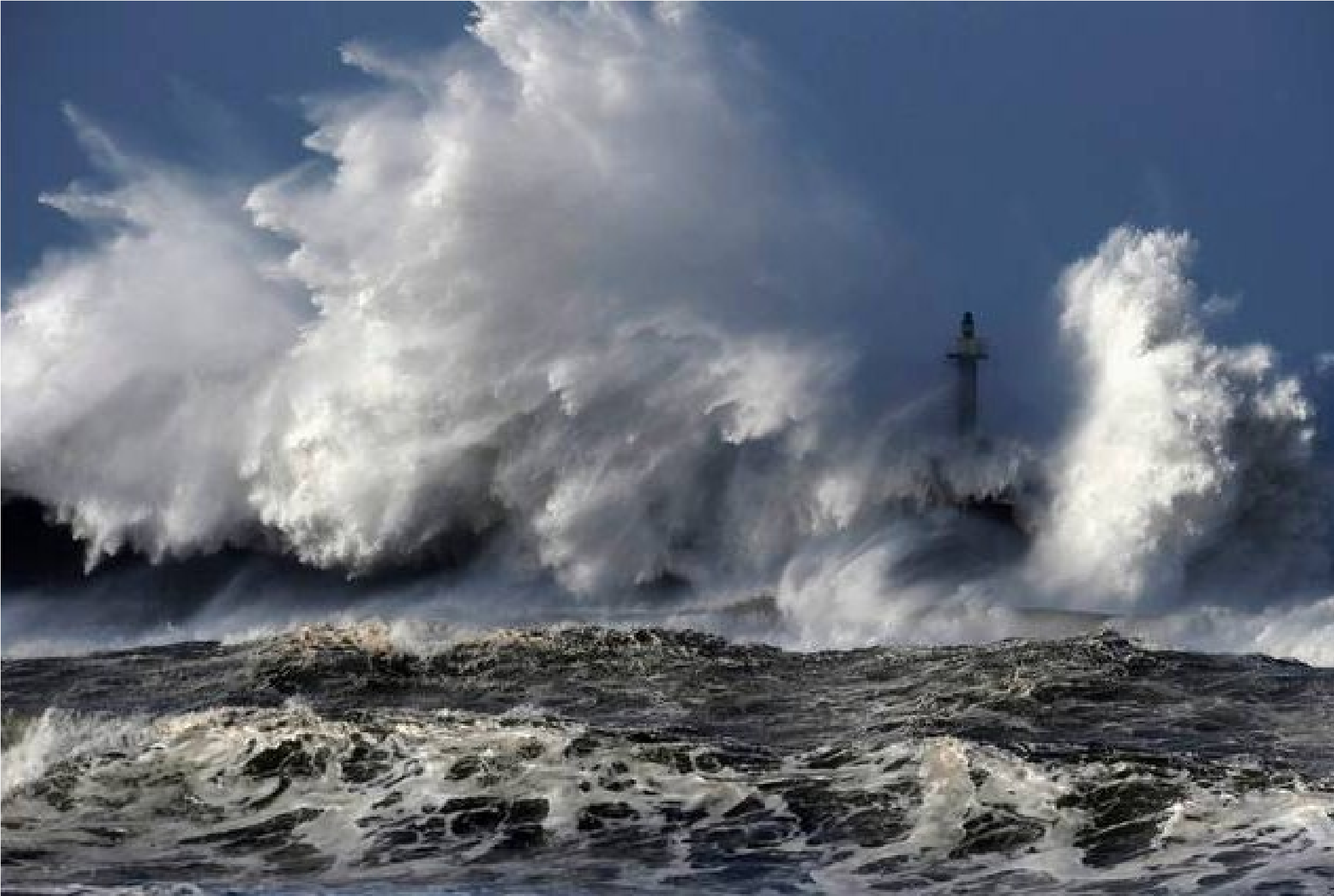
Espagne...San Esteban de Pravia