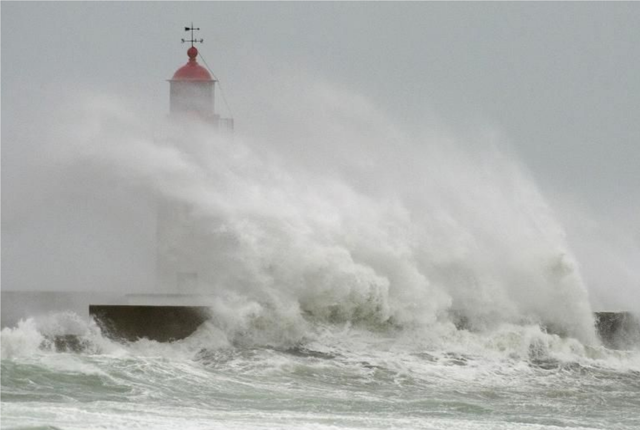
France...Finistère au Guilvinec