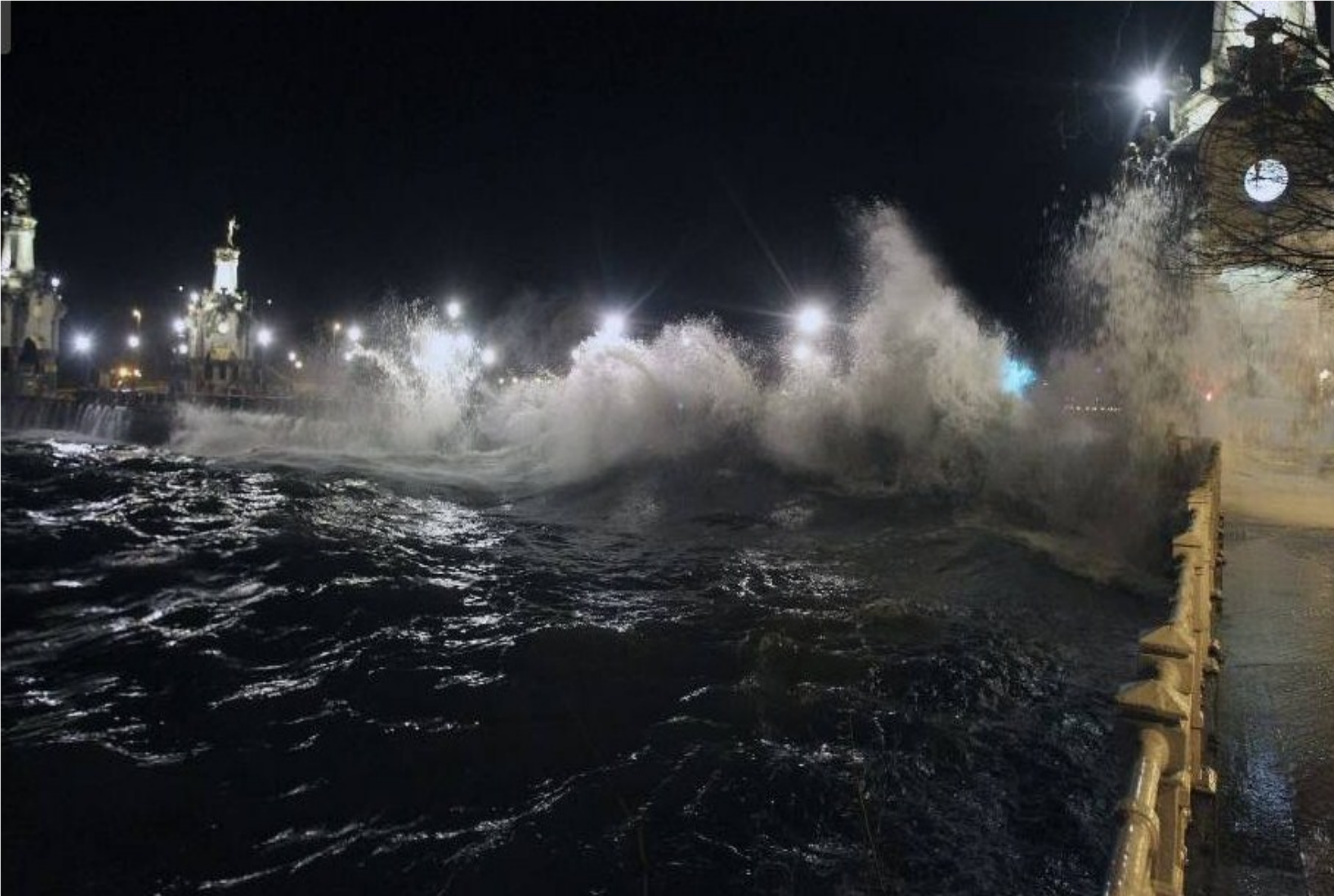
Espagne... Santa Catalina à San Sébastian