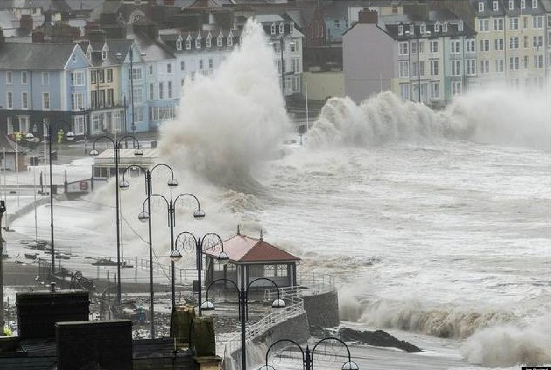
Grande-Bretagne...Pays de Galles