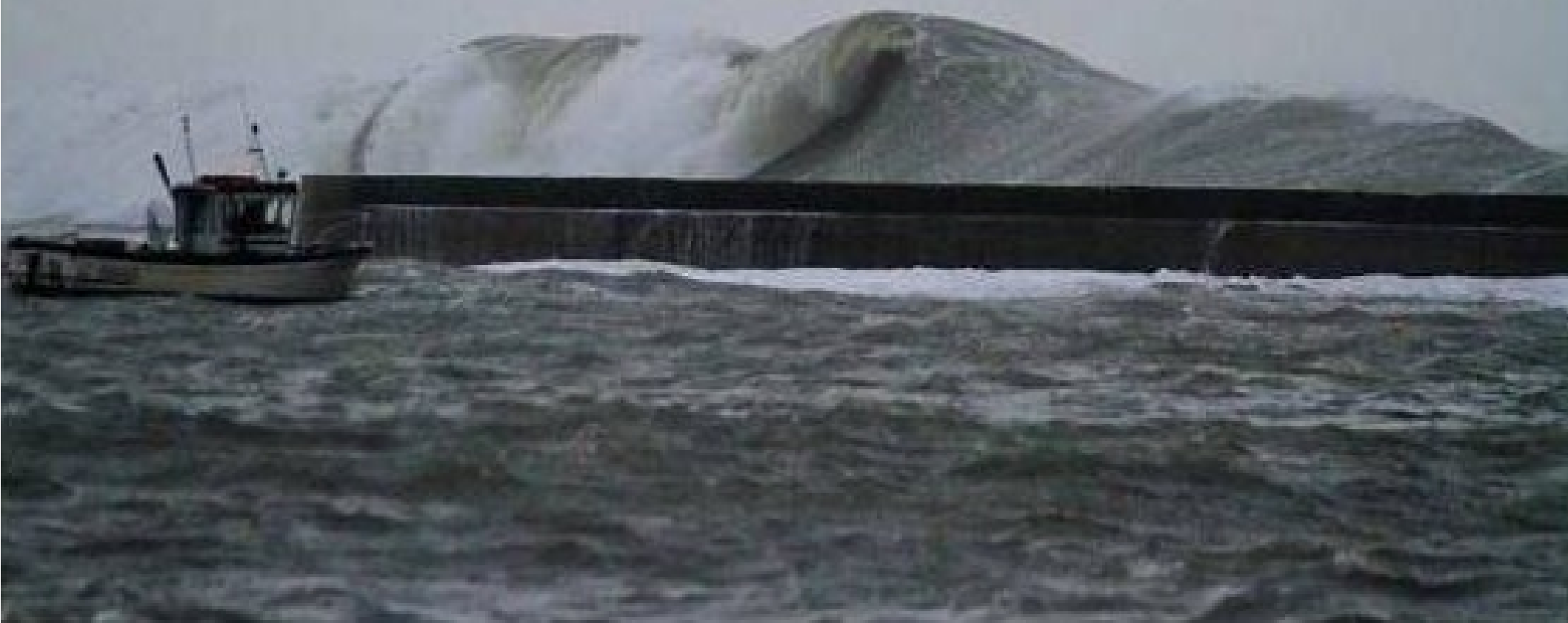
France...Morbihan à Ploemeur