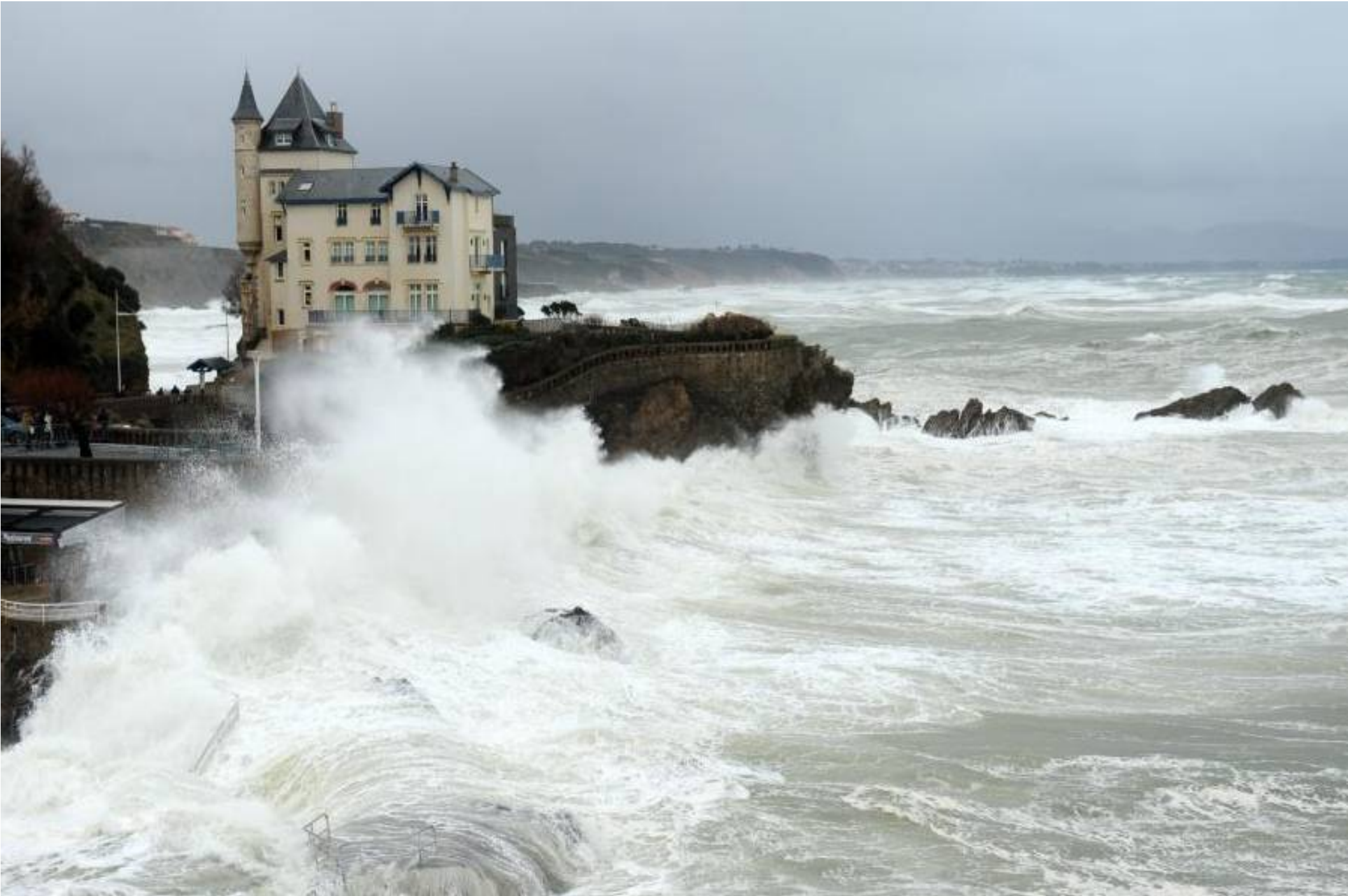
France...Pyrénées-Atlantiques à Biarritz