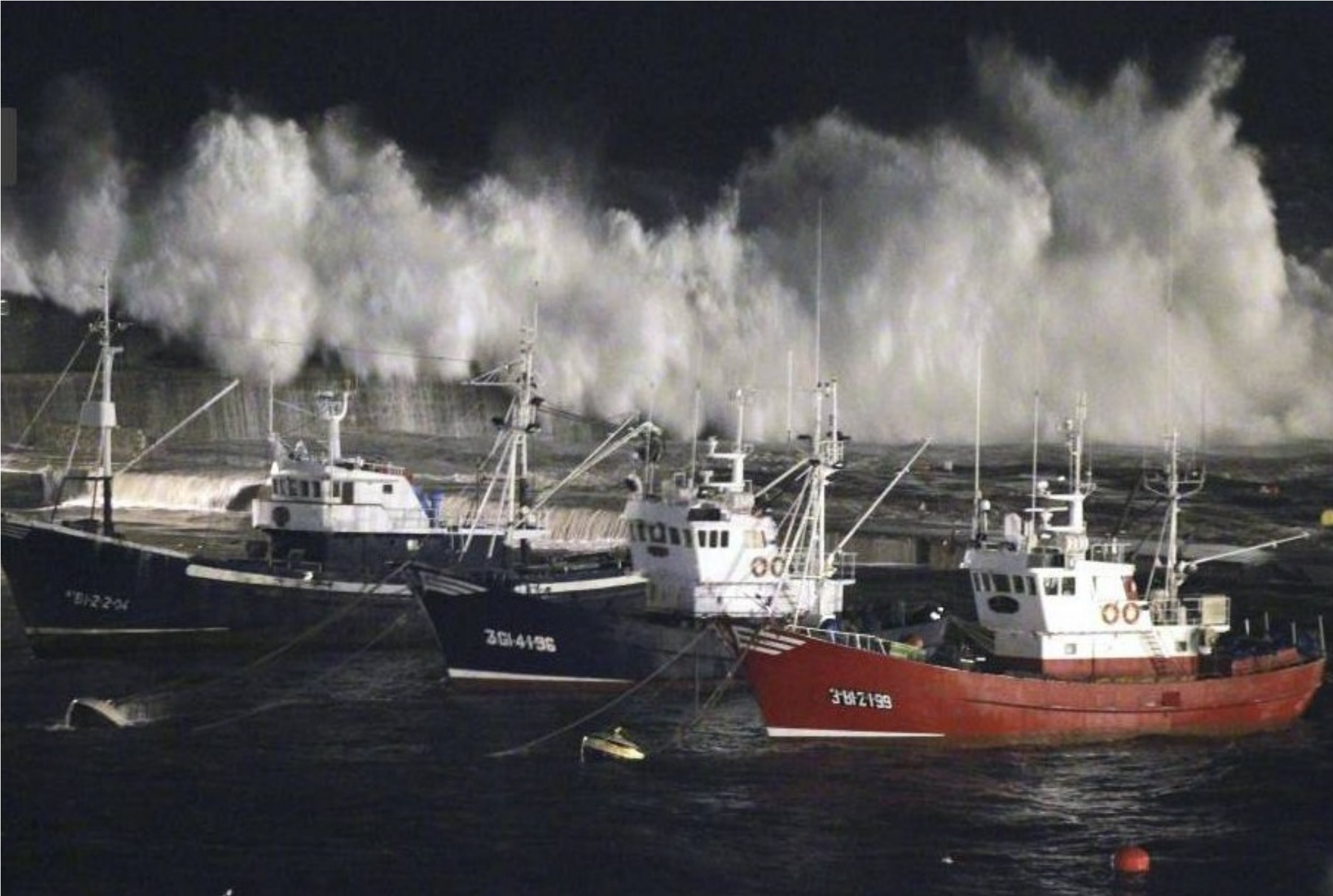
Espagne...Port de Berméo