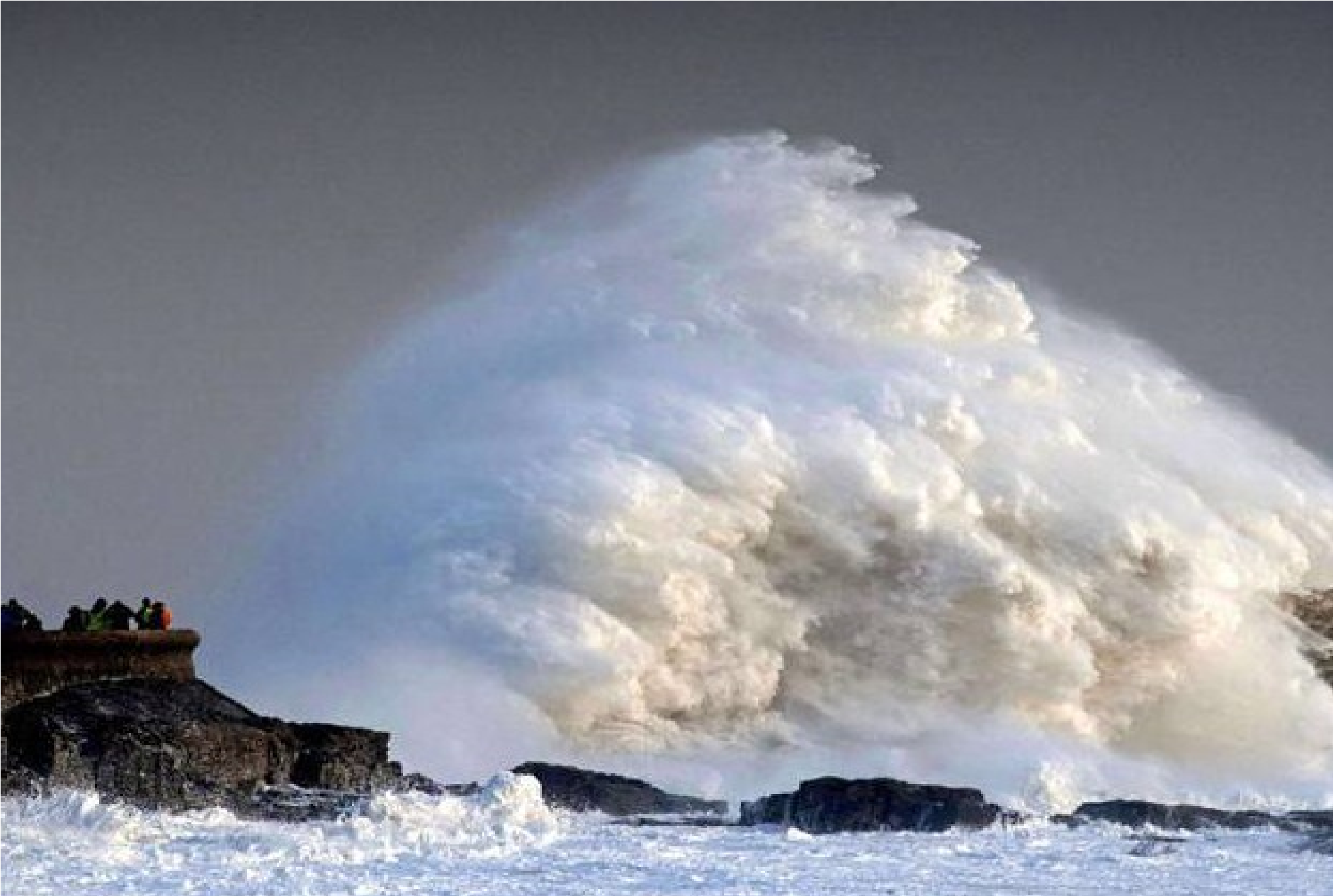
Grande Bretagne ...Porthcawl