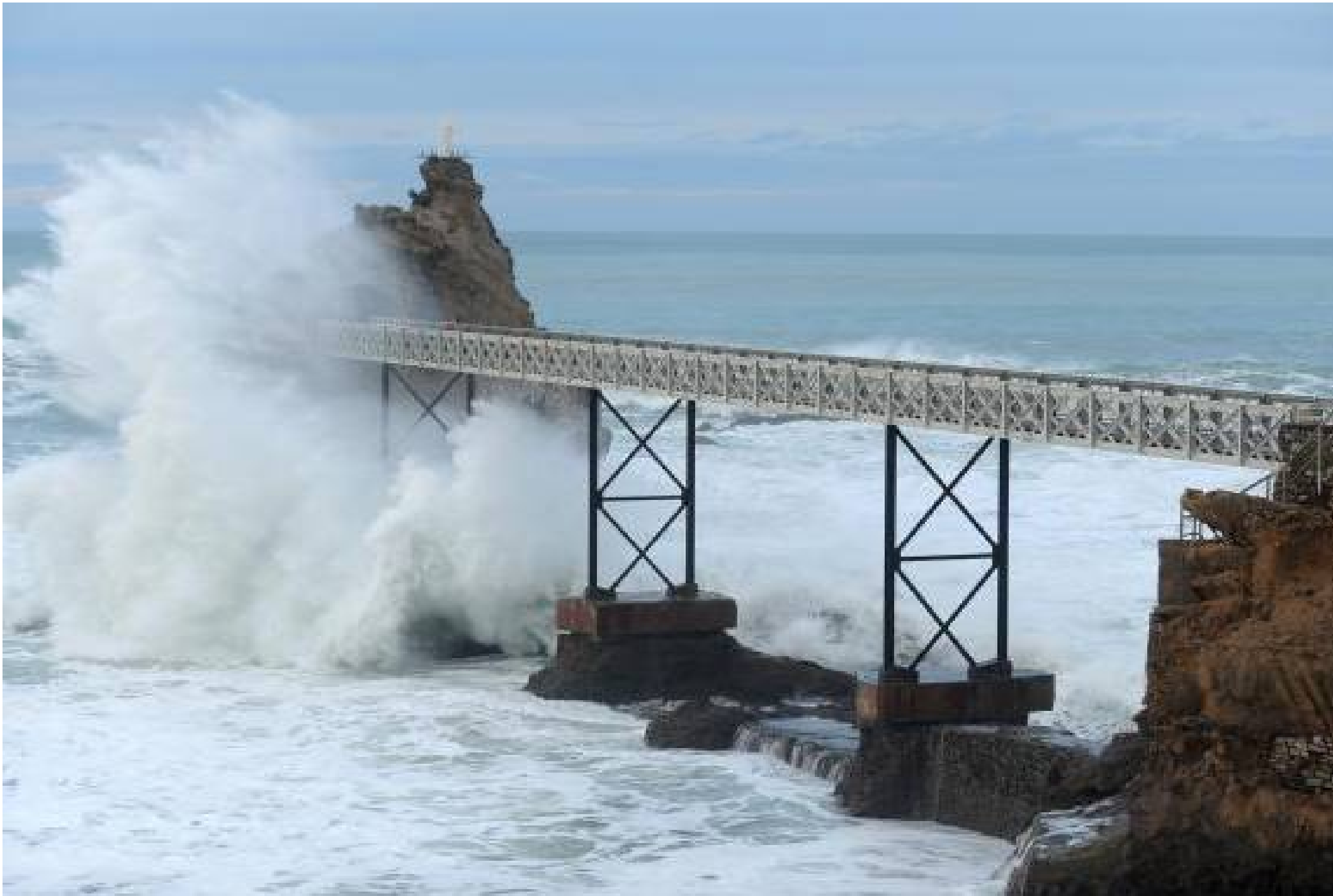
France...Pyrénées-Atlantiques...à Biarritz...le Rocher de la Vierge