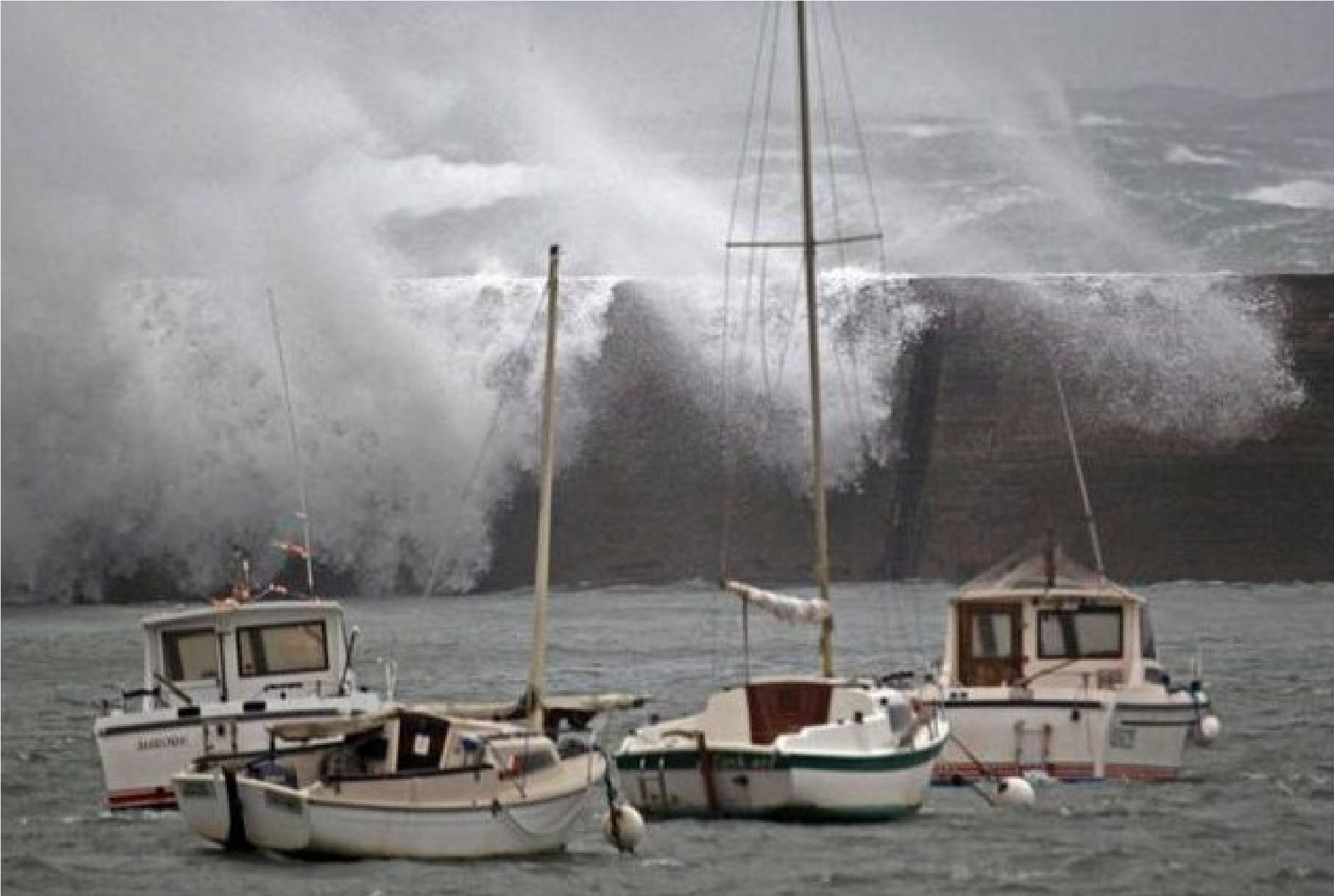
France...Finistère...Vague sur la digue d' Esquibien