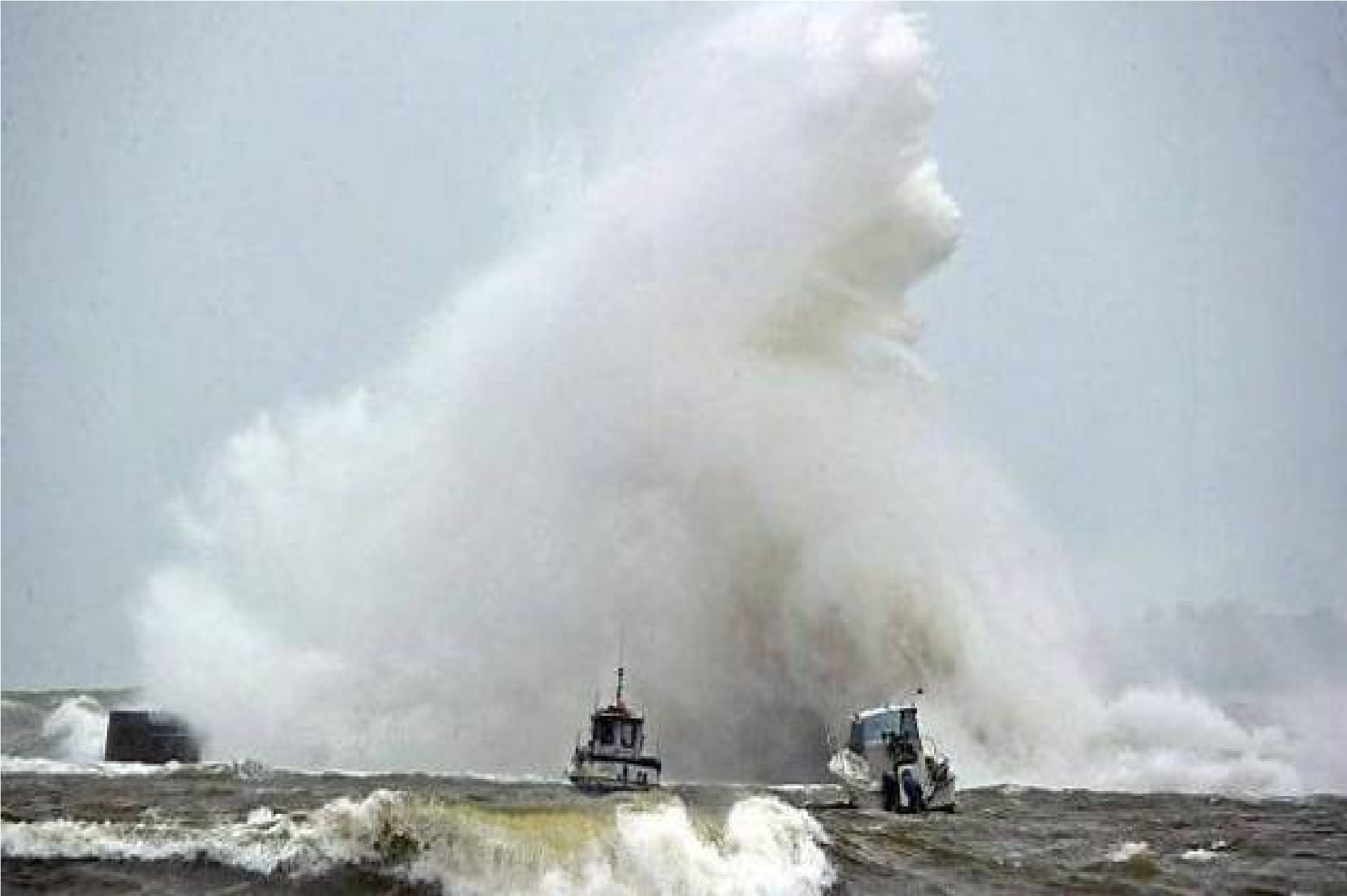
France...Morbihan à Lomener-Ploermeur