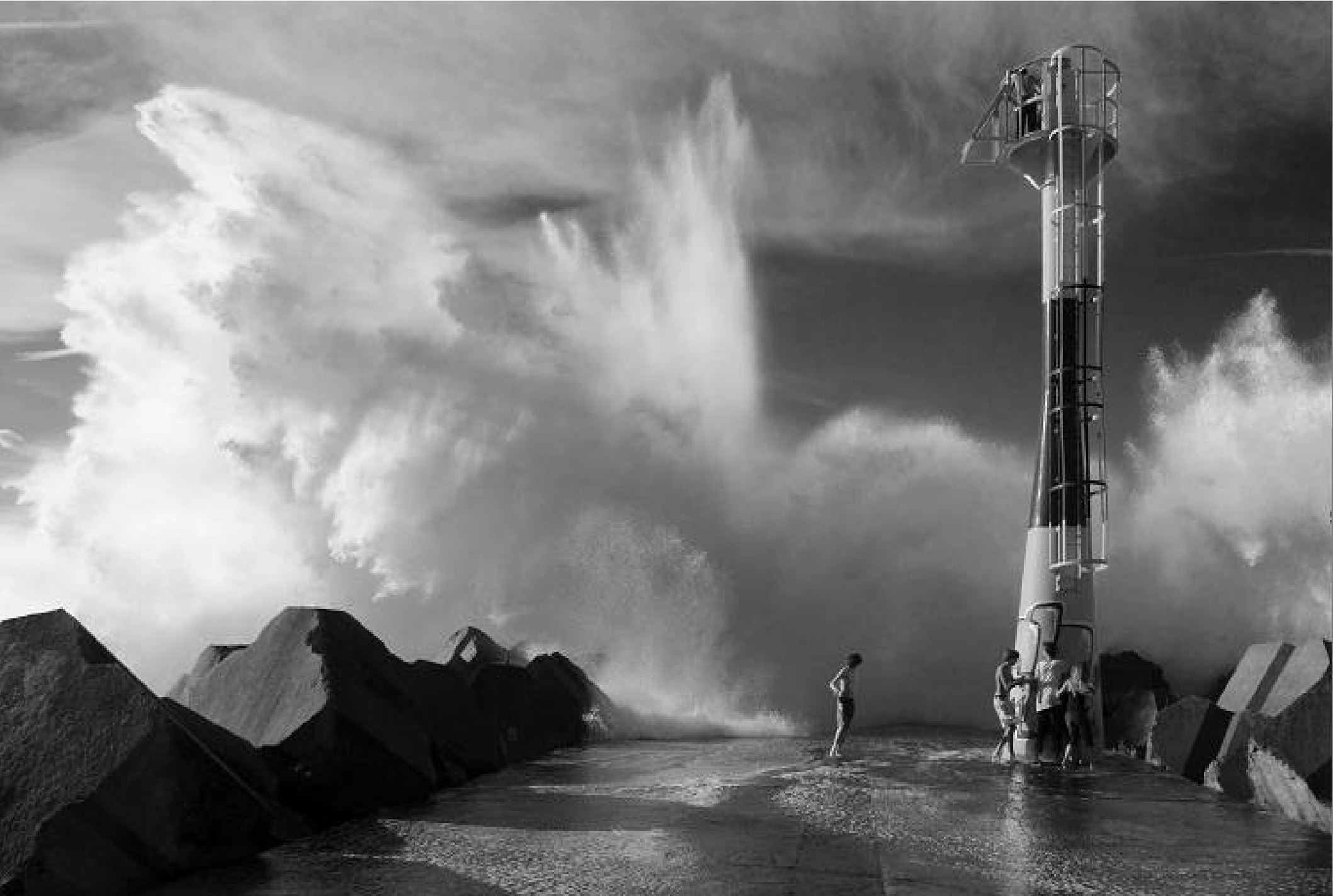
France...Pyrénées-Atlantiques à Anglet