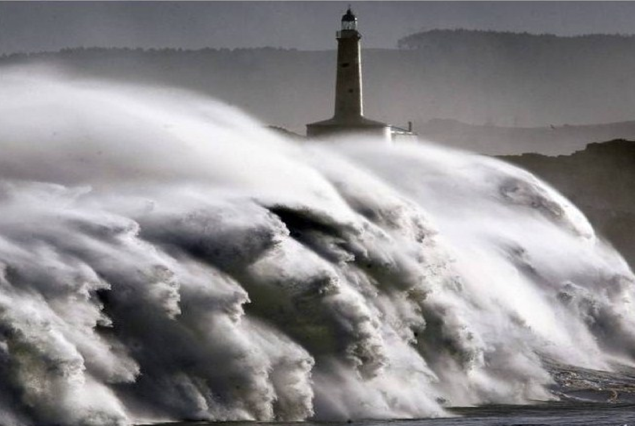
Espagne... Entrée de la Baie de Santander