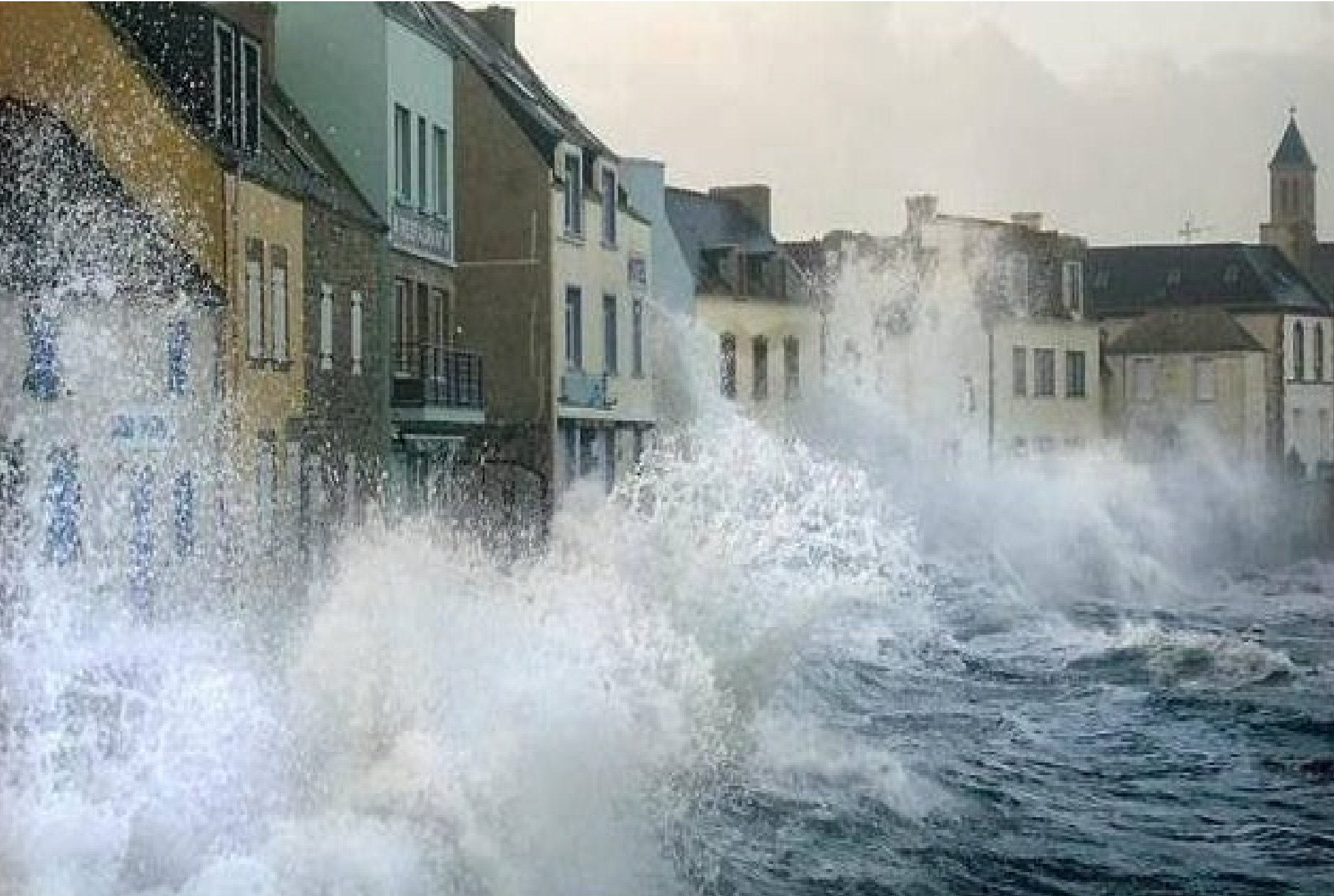
France... Finistère ...ile de Sein....le quai des Paimpolais