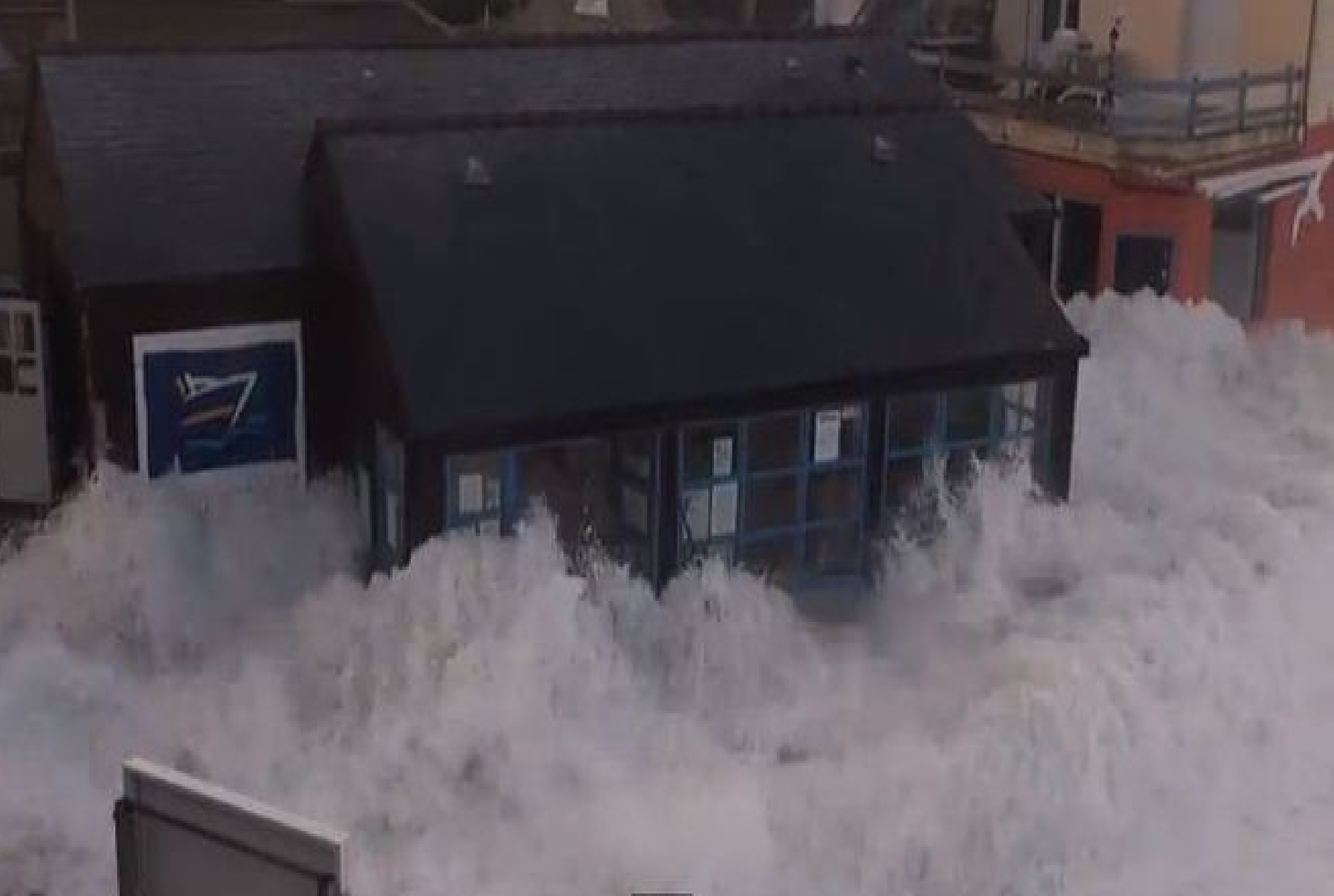
France...Finistère... Ile de Sein ( la gare maritime est ravagée)