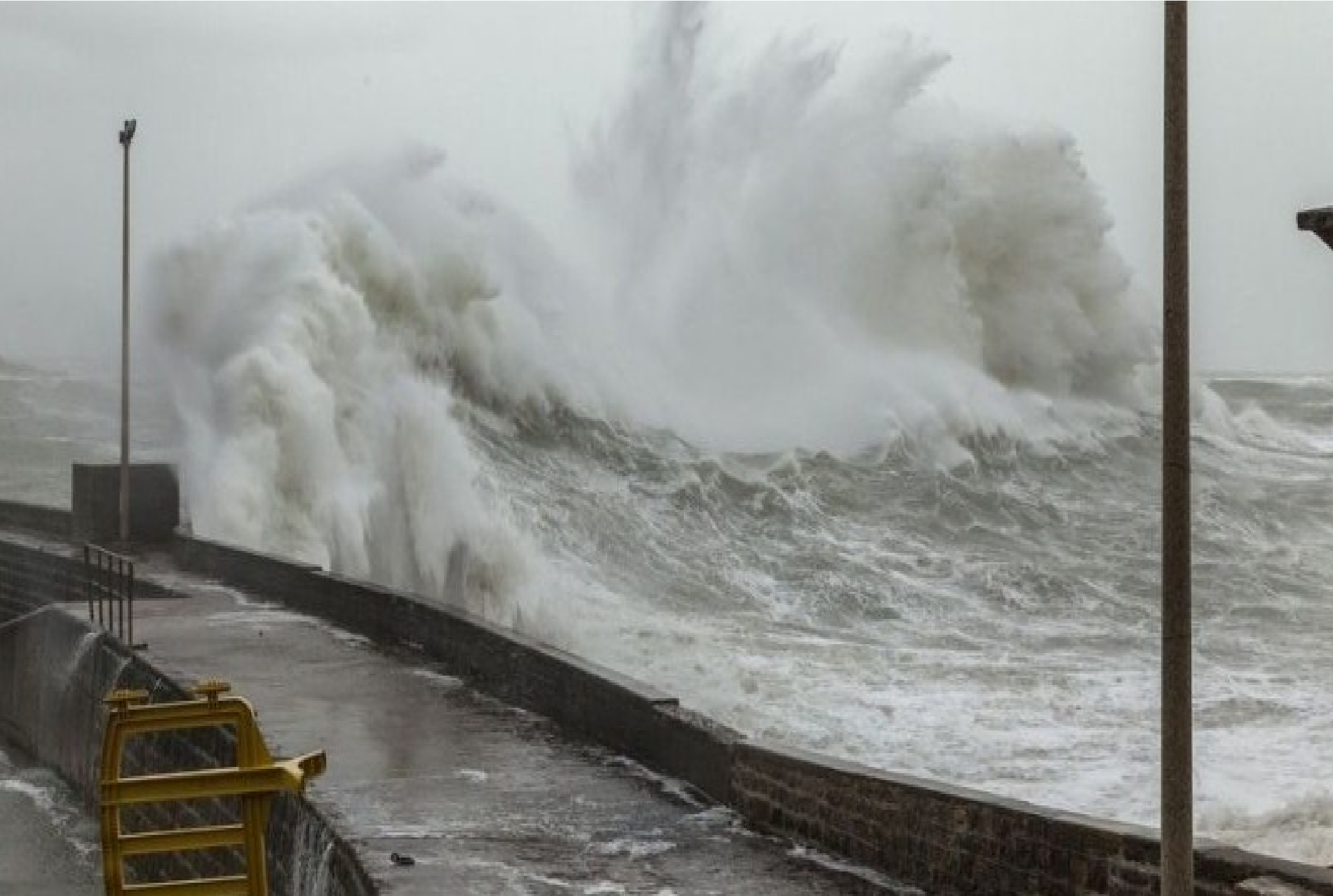
France...Morbihan à Lomener-Ploermeur