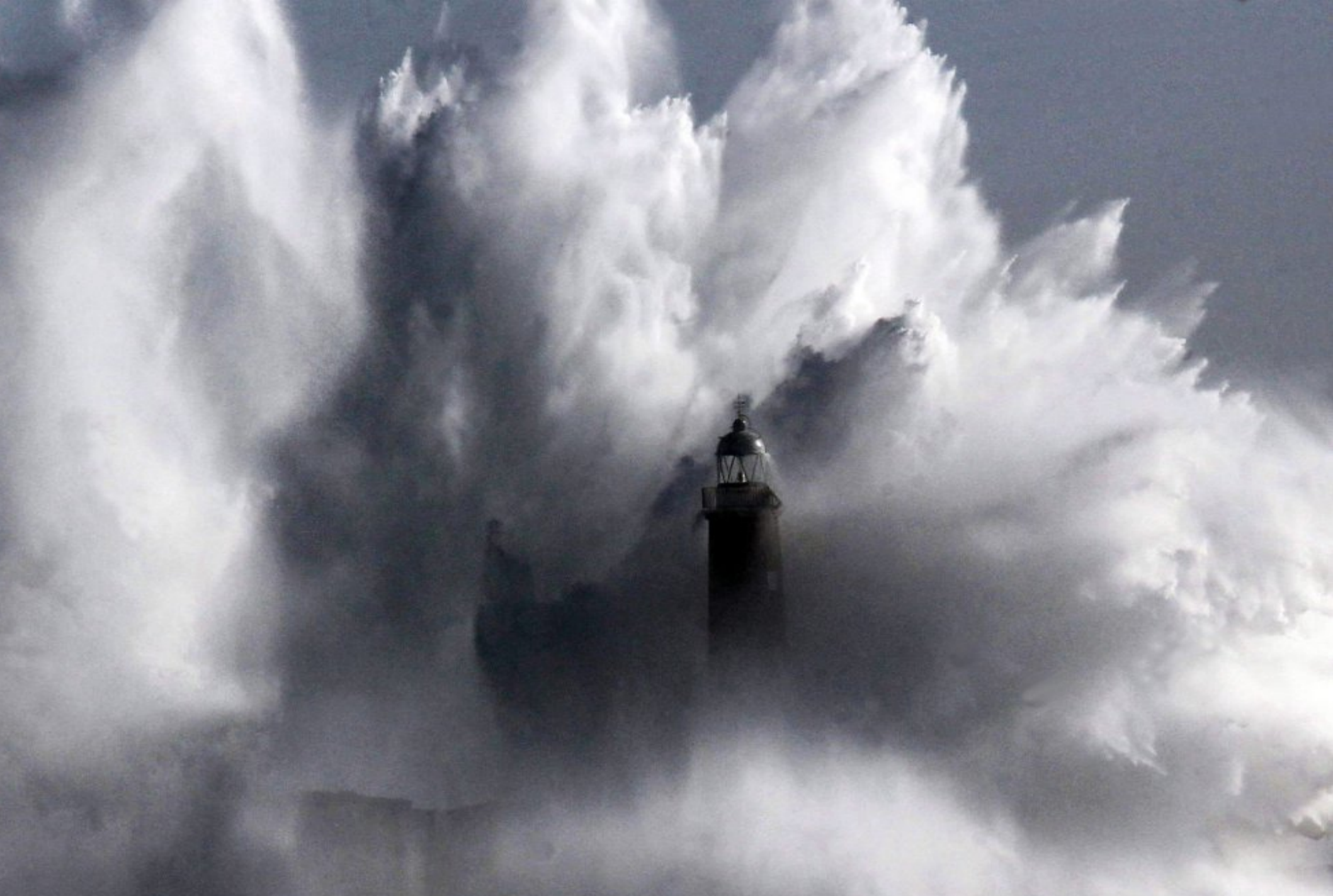
Espagne ...Ile de Mouro à Santander