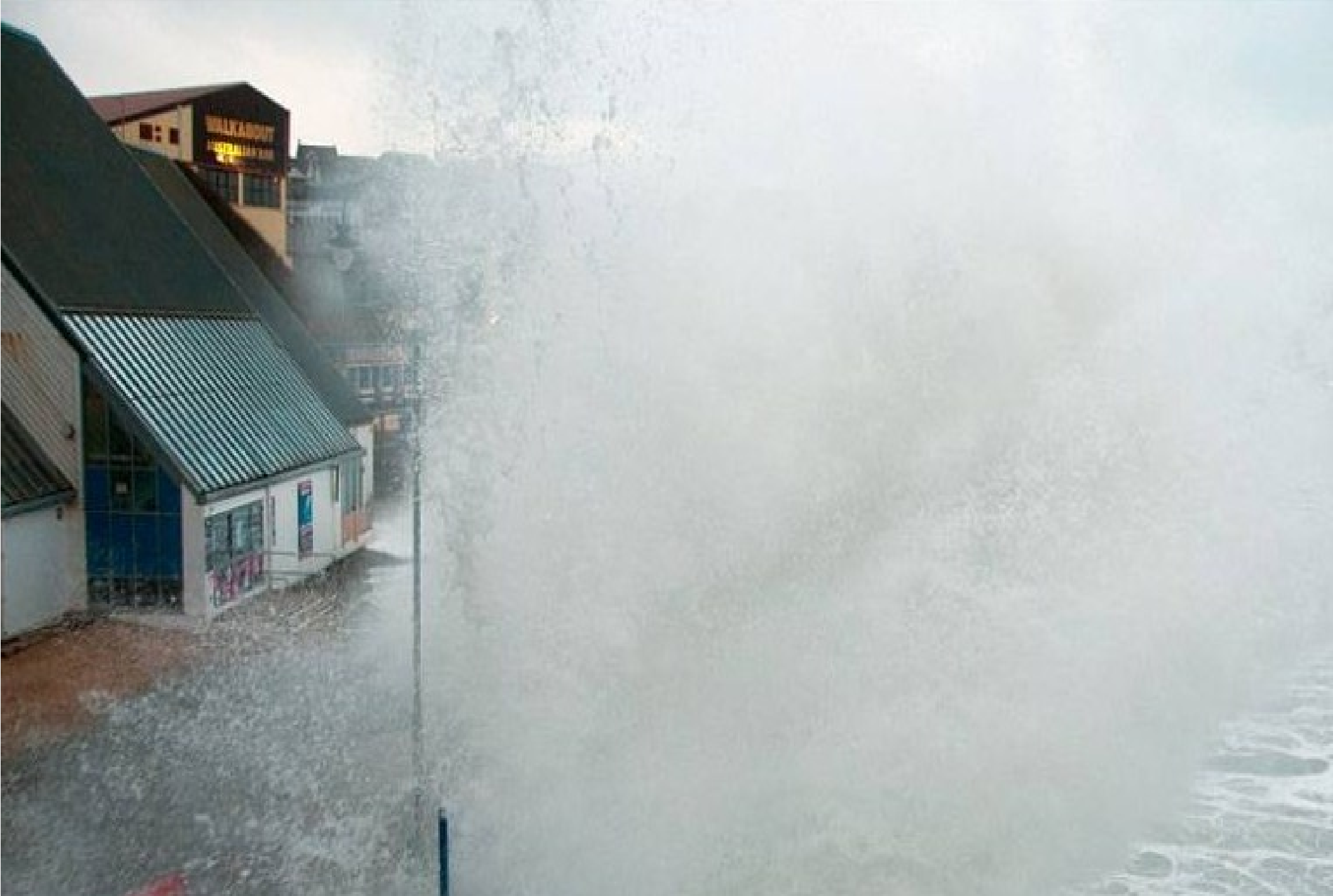
Grande-Bretagne...à Towan Beach