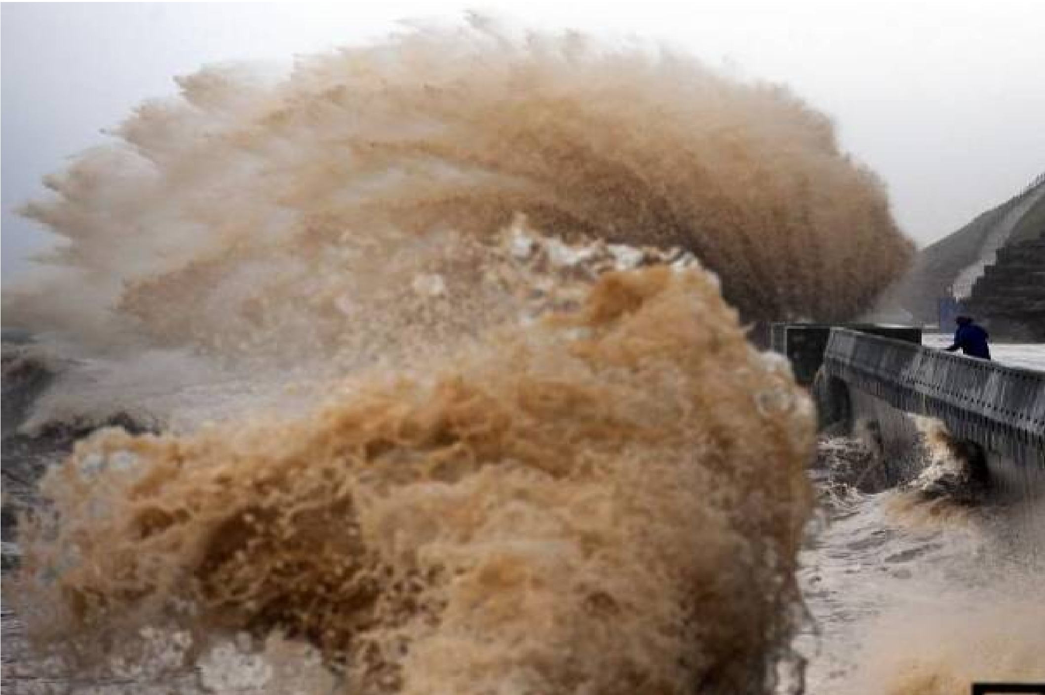
Grande-Bretagne... à Dorset